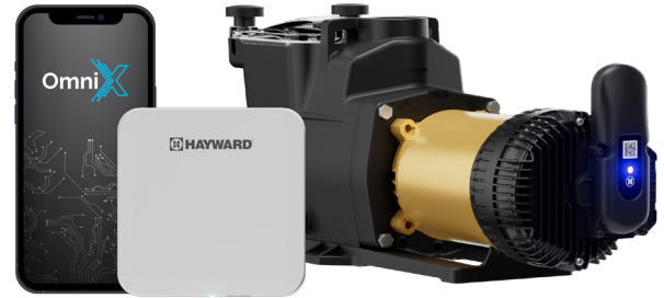
OmniX Gateway Sold Separately Vendu séparément